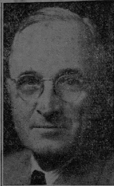
El Presidente Truman

Las mujeres valen más que los hombres, pues son más aptas para sacrificarse por la dicha ajena. Dios, que se ha arrepentido de haber he-